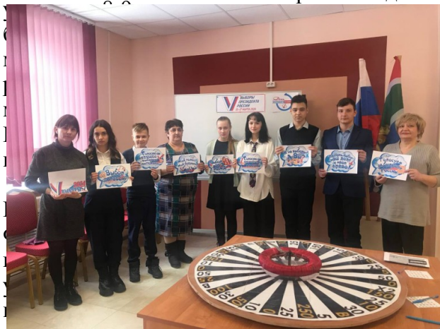
Затем с ребятами